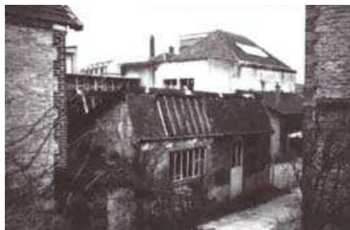
▷ Ateliers de façonnier.

A une tradition de coopération agricole très proche, l'Aube associe, une activité industrielle plus marquée, tournée vers la métallurgie (forges et laminoirs de Clairvaux...) et surtout le textile (le drap et l'industrie bonnetière de Troyes). Les établissements Devanlay-Lacoste prolongent aujourd'hui encore cette tradition textile.