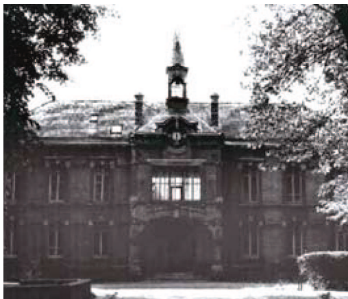
△ Warmeriville. Bâtiment principal de la filature Harmel.