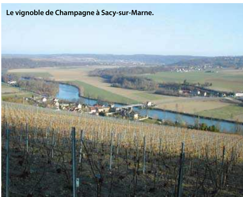
Le vignoble de Champagne à Sacy-sur-Marne.

En 2002, un inventaire de l'économie sociale en Champagne-Ardenne est réalisé par des chercheurs de l'université de Reims (2) . Il confirme le poids considérable de la coopération qui représente plus de 30 % de l'économie sociale et solidaire (contre 15 % au niveau national). Le nombre et la taille des établissements recensés concernant la coopération agricole (3) suscitent alors des réactions : Champagne Céréales , leader